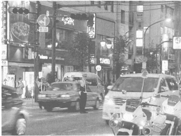
信号機(左上)が点灯せず、手信号で交通整理する警察官。12日午後5時19分、東京都豊島区