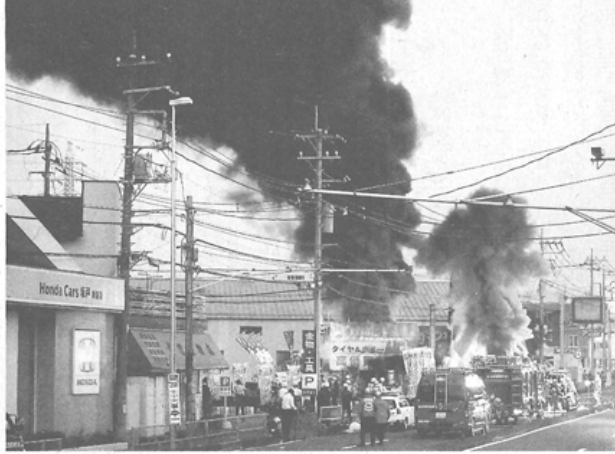
東京電力の関連施設から上がる黒煙。12日午後5時23分、埼玉県新座市

映中の映画が中断。一時外へに出た観客もいたという。東京地裁や高裁が入る東京・霞が関の庁舎も薄暗くなった。手荷物検査の機器が使えず、警備員が手荷物を直接調べた。エレベーター前では職員が「いつ止まるか分からないので利用を控えてください」と呼び掛